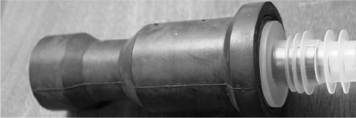
Pre-coded Şişe Ağzılığı Temizleme Kauçuğu (Pre-coded şişe ağzılığı ile birlikte)